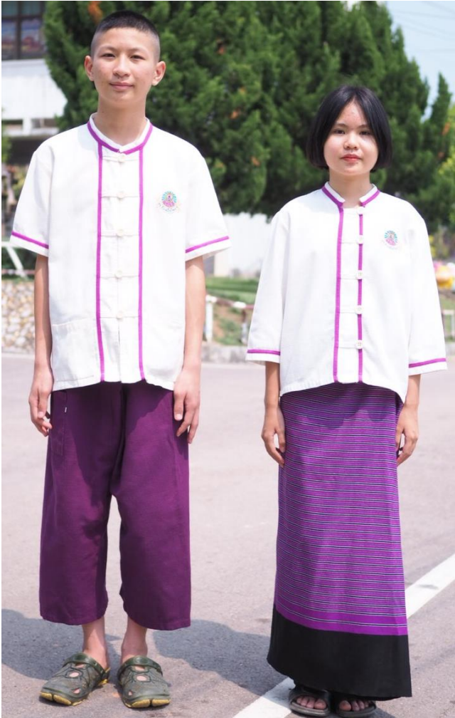
คู่มือนักเรียนและผู้ปกครอง โรงเรียนวังเหนือวิทยา